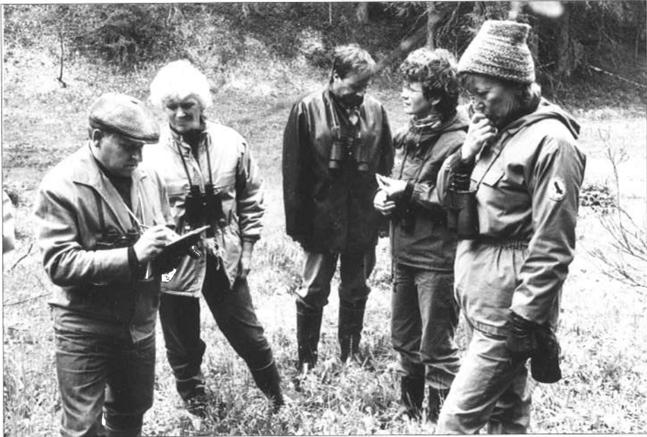
Akttiivisa ilyy:läisiä retkellä.