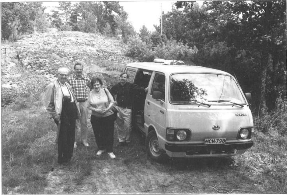
Retkellä Lounais-Suomeen, Ahvenmaalle ja Ruotsiin.

-Kiurujoen vastaista käyttöä selvittävä Kiurujokitoimikunta 1974-76, 1980 -Iisalmen kaupungin alueella luonnonsuojelulain nojalla rauhoitettavia kohteita selvittävä toimikunta 1975 -Kuopion läänin ympäristönsuojelun neuvottelukunta 1976-88 -Pohjois-Savon Luonnonsuojelupiiri 1979- -Savon vesien suojeluyhdistys 1980 -Kunnallinen luontopolkuryhmä 1981-95 -Iisalmen reitin yläosan vesiensuojelun neuvottelukunta 1982-85 -Onki- ja Poroveden säännöstelymääräysten uusimisen neuvottelukunta 1982-85 -Maailman Luonnonsätiön liito-oravan suojelutoimikunta 1983-95 -Matkusjoen entisöimistöryhmä 1984-85 -Sonkajärven vesireitin yleissuunnitelmatoimikunta 1986-88 -Ahmon- ja Kirmanjärvien kunnostus-